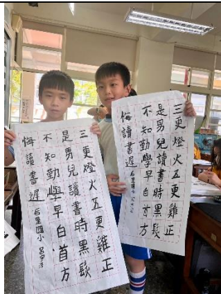
說明：學生展示自己作品