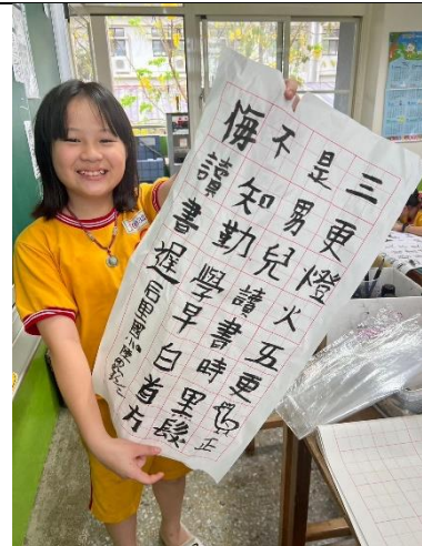
說明：學生展示自己作品