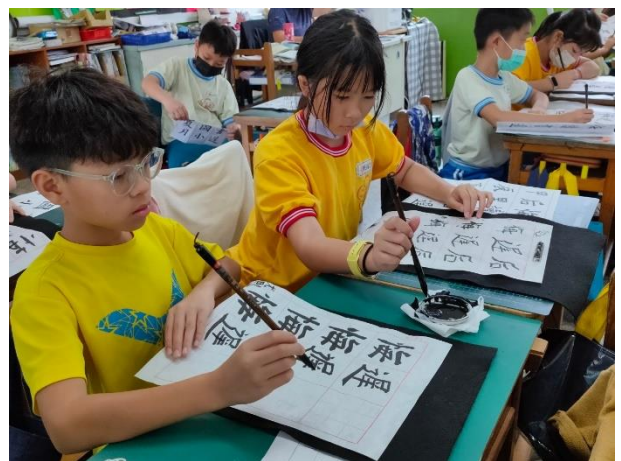
說明：學童專心練習書法