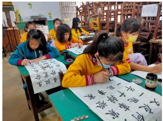
說明：書法培訓班練習