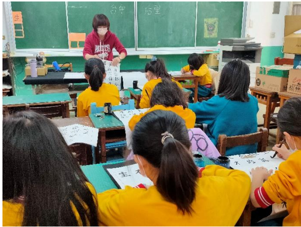
說明：書法培訓班練習