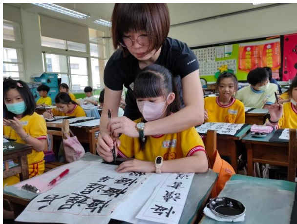
說明：老師指導握筆練習